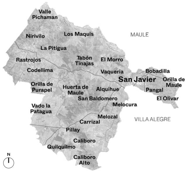
Mapa satelital de la comuna de San Javier de Loncomilla con algunos de sus sectores señalados.